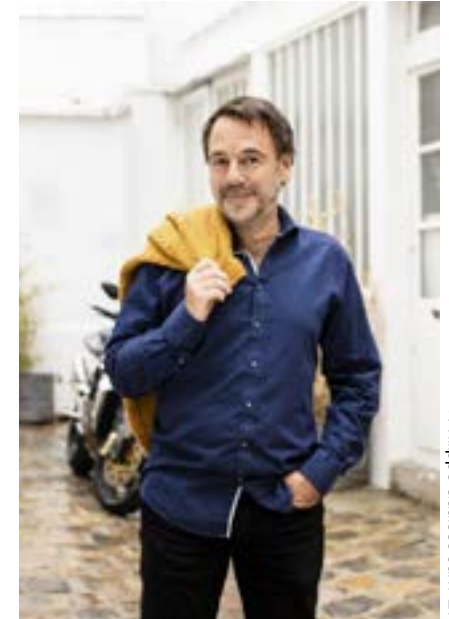
Janv 21

Géographe de formation, longtemps professeur d'université à Rouen, Michel Bussi a eu, très jeune, l'envie des mots et des intrigues. En quelques années, il est devenu l'un des auteurs les plus lus en France. Ses romans, concentrés de suspense, de virtuosité et d'émotions, décryptent aussi notre société d'un regard à la fois juste et moderne, toujours empreint d'humanité. Une signature qui vaut aujourd'hui à l'auteur de Nymphéas noirs , Maman a tort , Le temps est assassin , Rien ne t'efface , Code 612... d'être adapté avec succès en bandes dessinées, en séries pour la télévision, d'être traduit dans 37 pays et de faire vivre un lien fort avec ses lectrices et lecteurs.